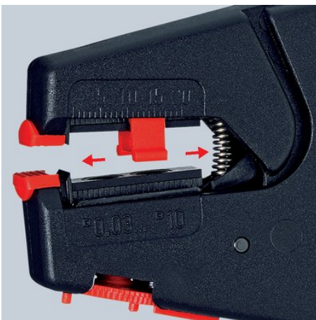
Передвижной ограничитель длины