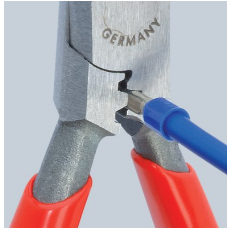
Опрессовка от 0,5 до 2,5 мм 2